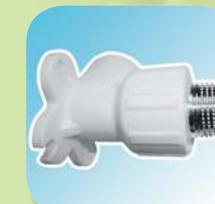
УГОЛЬНИК КОМБИНИРОВАННЫЙ С НАРУЖНОЙ РЕЗЬБОЙ (С КРЕПЛЕНИЕМ) Ø 20-1/2", 25-1/2", 25-3/4"