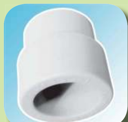
МУФТА ПЕРЕХОДНАЯ НАРУЖНАЯ / ВНУТРЕННЯЯ Ø 25/20, 32/20, 32/25, 40/20, 40/25, 40/32, 50/20, 50/25, 50/32, 50/40, 63/25, 63/32, 63/40, 63/50