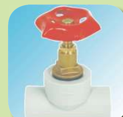
ВЕНТИЛЬ Ø 20-1/2", 20-3/4", 25-3/4", 32-1", 40-1"