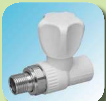
ВЕНТИЛЬ ПРЯМОЙ ДЛЯ РАДИАТОРА Ø 20-1/2"