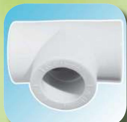
ТРОЙНИК 90° Ø 20, 25, 32, 40, 50, 63