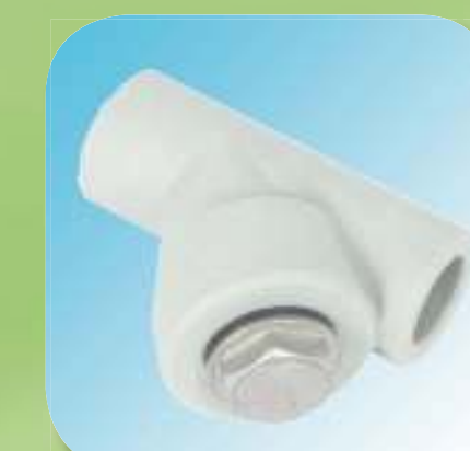
ФИЛЬТР МАМА - МАМА Ø 20, 25