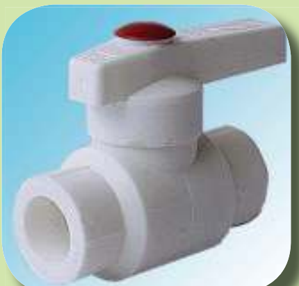
ШАРОВОЙ КРАН Ø 20, 25, 32, 40, 50, 63