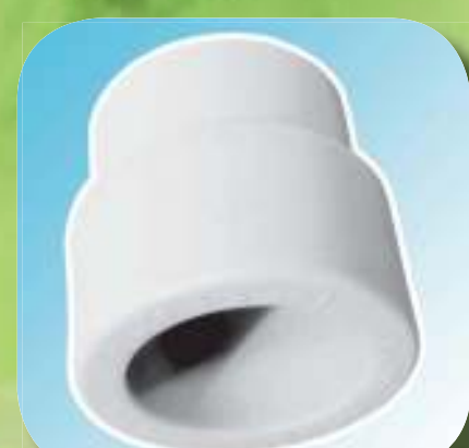
МУФТА ПЕРЕХОДНАЯ ВНУТРЕННЯЯ / ВНУТРЕННЯЯ Ø 25/20, 32/20, 32/25