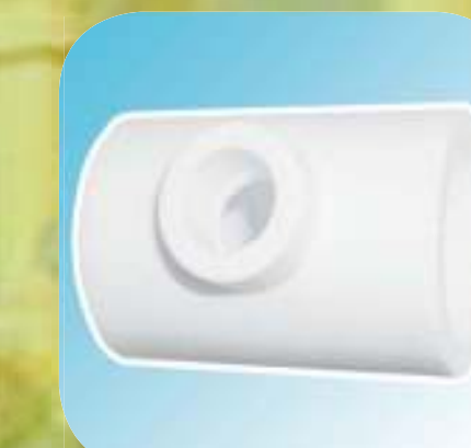
ТРОЙНИК ПЕРЕХОДНОЙ Ø 20-25-20, 25-20-20, 25- 20-25, 32-20-20, 32-20-32, 32-25-32, 40-20-40, 40-25- 40, 40-32-40, 50-20-50, 50- 25-50, 50-32-50, 50-40-50, 63-20-63, 63-25-63, 63-32- 63, 63-40-63, 63-50-63