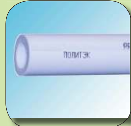
ТРУБА PN 20 Ø 20, 25, 32, 40, 50, 63