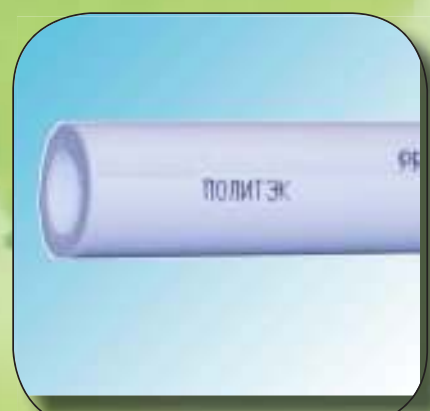
ТРУБА АРМИРОВАННАЯ СТЕКЛОВОЛОКНОМ РН 20 Ø 20, 25, 32, 40, 50, 63