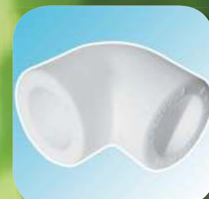
ОТВОД 90° Ø 20, 25, 32, 40, 50, 63