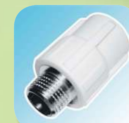
МУФТА КОМБИНИРОВАННАЯ С НАРУЖНОЙ РЕЗЬБОЙ Ø 20-1/2", 20-3/4", 25-1/2", 25-3/4", 32-3/4", 32-1"