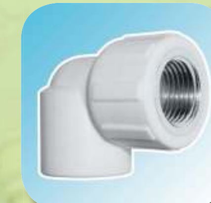
УГОЛЬНИК КОМБИНИРОВАННЫЙ С ВНУТРЕННЕЙ РЕЗЬБОЙ Ø 20-1/2", 20-3/4", 25-1/2", 25-3/4", 32-3/4", 32-1"