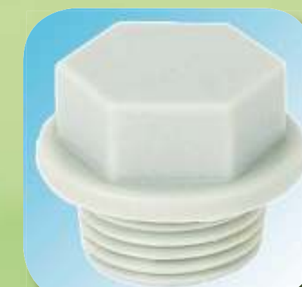
ЗАГЛУШКА С НАРУЖНОЙ РЕЗЬБОЙ Ø 1/2", 3/4", 1"