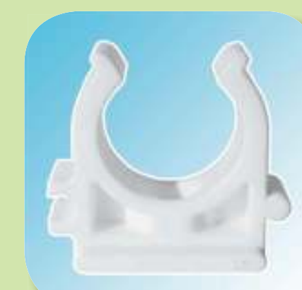
ОПОРА ДЛЯ ТРУБЫ Ø 20, 25, 32