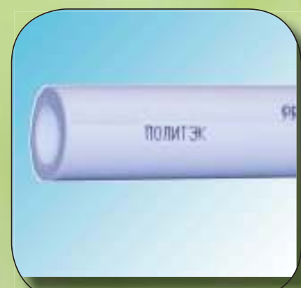
ТРУБА РН 20 Ø 20, 25, 32, 40, 50, 63