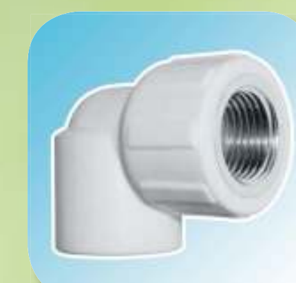
УГОЛЬНИК КОМБИНИРОВАННЫЙ С ВНУТРЕННЕЙ РЕЗЬБОЙ Ø 20-1/2", 20-3/4", 25-1/2", 25-3/4", 32-3/4", 32-1"