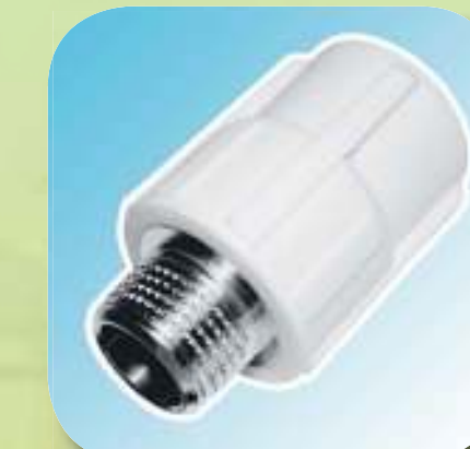
МУФТА КОМБИНИРОВАННАЯ С НАРУЖНОЙ РЕЗЬБОЙ Ø 20-1/2", 20-3/4", 25-1/2", 25-3/4", 32-3/4", 32-1"