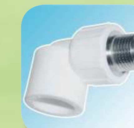
УГОЛЬНИК КОМБИНИРОВАННЫЙ С НАРУЖНОЙ РЕЗЬБОЙ Ø 20-1/2", 20-3/4", 25-1/2", 25-3/4", 32-3/4", 32-1"