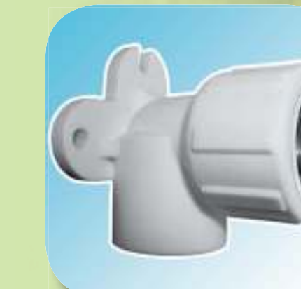
УГОЛЬНИК КОМБИНИРОВАННЫЙ С ВНУТРЕННЕЙ РЕЗЬБОЙ (С КРЕПЛЕНИЕМ) Ø 20-1/2", 25-1/2", 25-3/4"