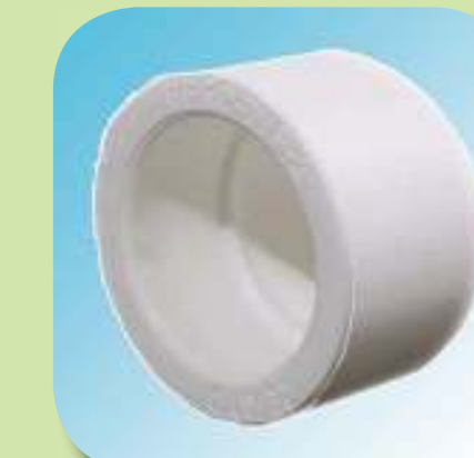
ЗАГЛУШКА Ø 20, 25, 32, 40, 50, 63