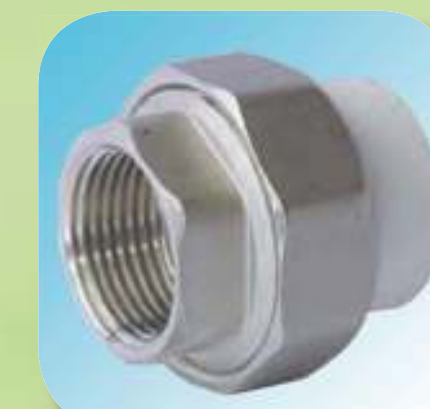
МУФТА КОМБИНИРОВАННАЯ РАЗЪЕМНАЯ С ВНУТРЕННЕЙ РЕЗЬБОЙ Ø 20-1/2", 25-3/4", 32-1", 40-1 1/4", 50-1 1/2", 63-2"