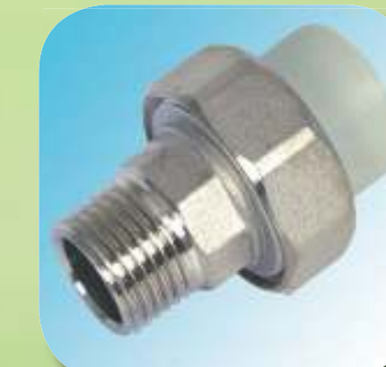
МУФТА КОМБИНИРОВАННАЯ РАЗЪЕМНАЯ С НАРУЖНОЙ РЕЗЬБОЙ Ø 20-1/2", 25-3/4", 32-1", 40-1 1/4", 50-1 1/2", 63-2"