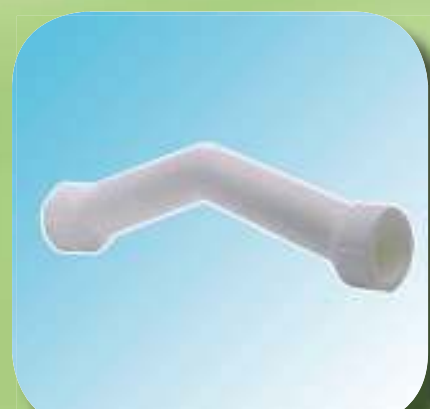
ОБВОД Ø 20, 25, 32