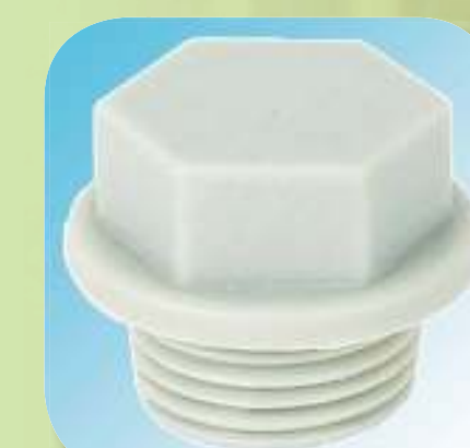
ЗАГЛУШКА С НАРУЖНОЙ РЕЗЬБОЙ Ø 1/2", 3/4", 1"