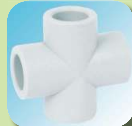
КРЕСТОВИНА Ø 20, 25, 32, 40,