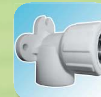
УГОЛЬНИК КОМБИНИРОВАННЫЙ С ВНУТРЕННЕЙ РЕЗЬБОЙ (С КРЕПЛЕНИЕМ) Ø 20-1/2", 25-1/2", 25-3/4"