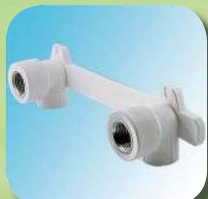
УГОЛЬНИК КОМБИНИРОВАННЫЙ С КРЕПЛЕНИЕМ ДВОЙНОЙ