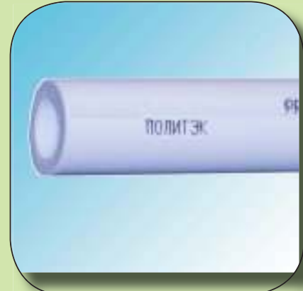
ТРУБА АРМИРОВАННАЯ СТЕКЛОВОЛОКНОМ PN 20 Ø 20, 25, 32, 40, 50, 63