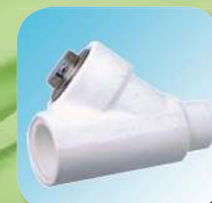
ФИЛЬТР ПАПА - МАМА Ø 20, 25