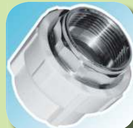
МУФТА КОМБИНИРОВАННАЯ С ВНУТРЕННЕЙ РЕЗЬБОЙ (ПОД КЛЮЧ) Ø 32-1", 40-1 1/4", 50-1 1/2", 63-2"