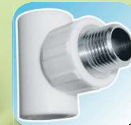
ТРОЙНИК КОМБИНИРОВАННЫЙ С НАРУЖНОЙ РЕЗЬБОЙ Ø 20-1/2", 20-3/4", 25-1/2", 25-3/4", 32-3/4", 32-1"