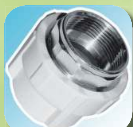
МУФТА КОМБИНИРОВАННАЯ С ВНУТРЕННЕЙ РЕЗЬБОЙ (ПОД КЛЮЧ) Ø 32-1", 40-1 1/4", 50-1 1/2", 63-2"