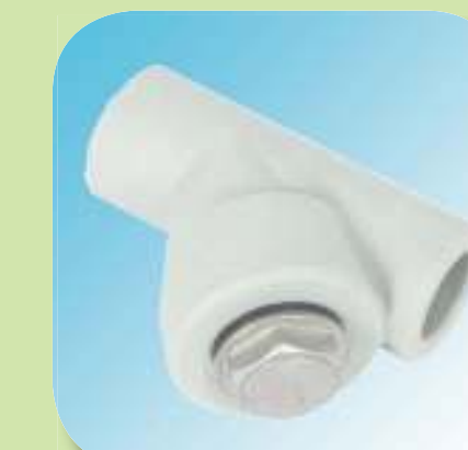
ФИЛЬТР МАМА - МАМА Ø 20, 25