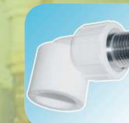
УГОЛЬНИК КОМБИНИРОВАННЫЙ С НАРУЖНОЙ РЕЗЬБОЙ Ø 20-1/2", 20-3/4", 25-1/2", 25-3/4", 32-3/4", 32-1"