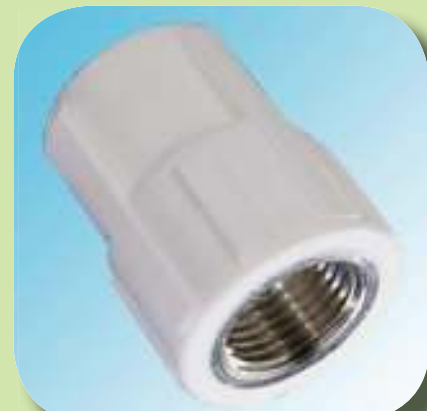
МУФТА КОМБИНИРОВАННАЯ С ВНУТРЕННЕЙ РЕЗЬБОЙ Ø 20-1/2", 20-3/4", 25-1/2", 25-3/4", 32-3/4", 32-1"