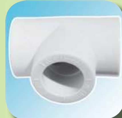
ТРОЙНИК 90° Ø 20, 25, 32, 40, 50, 63