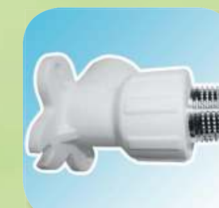
УГОЛЬНИК КОМБИНИРОВАННЫЙ С НАРУЖНОЙ РЕЗЬБОЙ (С КРЕПЛЕНИЕМ) Ø 20-1/2", 25-1/2", 25-3/4"