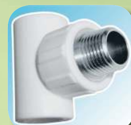
ТРОЙНИК КОМБИНИРОВАННЫЙ С НАРУЖНОЙ РЕЗЬБОЙ Ø 20-1/2", 20-3/4", 25-1/2", 25-3/4", 32-3/4", 32-1"