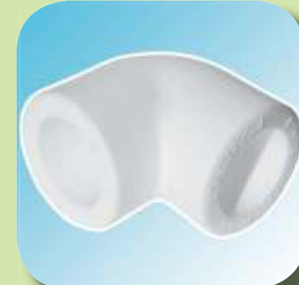
ОТВОД 90° Ø 20, 25, 32, 40, 50, 63