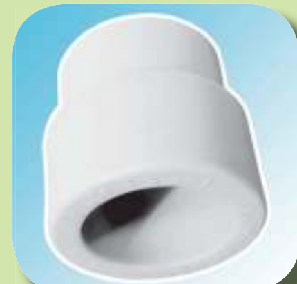
МУФТА ПЕРЕХОДНАЯ ВНУТРЕННЯЯ / ВНУТРЕННЯЯ Ø 25/20, 32/20, 32/25