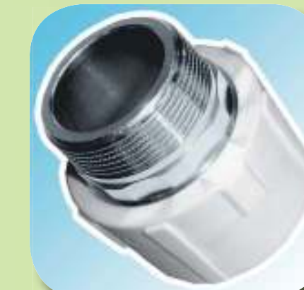
МУФТА КОМБИНИРОВАННАЯ С НАРУЖНОЙ РЕЗЬБОЙ (ПОД КЛЮЧ) Ø 32-1", 40-1 1/4", 50-1 1/2", 63-2"