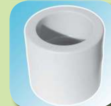
МУФТА Ø 20, 25, 32, 40, 50, 63