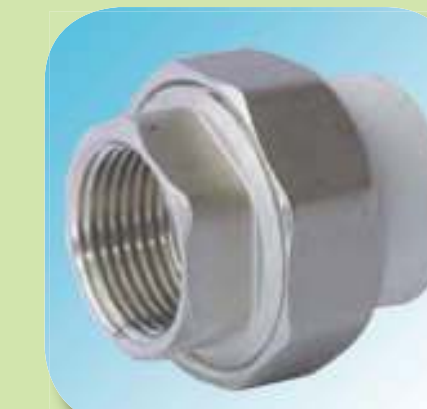
МУФТА КОМБИНИРОВАННАЯ РАЗЪЕМНАЯ С ВНУТРЕННЕЙ РЕЗЬБОЙ Ø 20-1/2", 25-3/4", 32-1", 40-1 1/4", 50-1 1/2", 63-2"