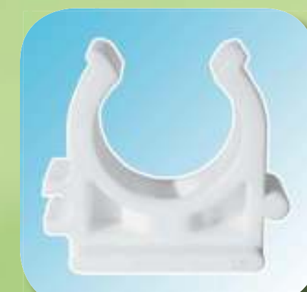
ОПОРА ДЛЯ ТРУБЫ Ø 20, 25, 32