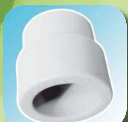
МУФТА ПЕРЕХОДНАЯ НАРУЖНАЯ / ВНУТРЕННЯЯ Ø 25/20, 32/20, 32/25, 40/20, 40/25, 40/32, 50/20, 50/25, 50/32, 50/40, 63/25, 63/32, 63/40, 63/50