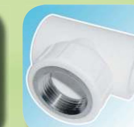
ТРОЙНИК КОМБИНИРОВАННЫЙ С ВНУТРЕННЕЙ РЕЗЬБОЙ Ø 20-1/2", 20-3/4", 25-1/2", 25-3/4", 32-3/4", 32-1"