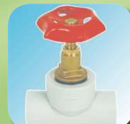
ВЕНТИЛЬ Ø 20-1/2", 20-3/4", 25-3/4", 32-1", 40-1"