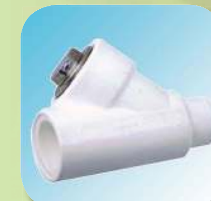
ФИЛЬТР ПАПА - МАМА Ø 20, 25