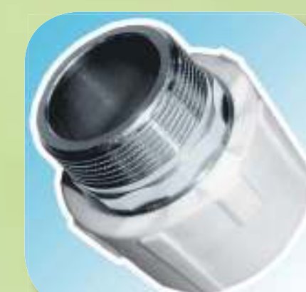
МУФТА КОМБИНИРОВАННАЯ С НАРУЖНОЙ РЕЗЬБОЙ (ПОД КЛЮЧ) Ø 32-1", 40-1 1/4", 50-1 1/2", 63-2"