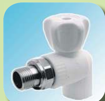
ВЕНТИЛЬ УГЛОВОЙ ДЛЯ РАДИАТОРА Ø 20-1/2"