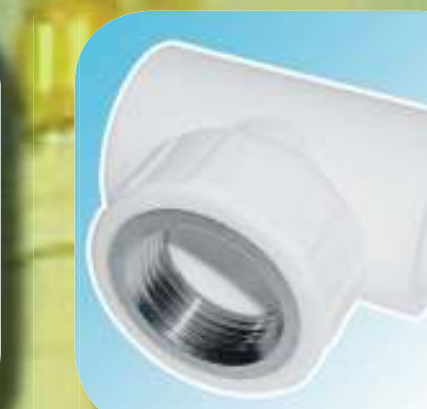
ТРОЙНИК КОМБИНИРОВАННЫЙ С ВНУТРЕННЕЙ РЕЗЬБОЙ Ø 20-1/2", 20-3/4", 25-1/2", 25-3/4", 32-3/4", 32-1"