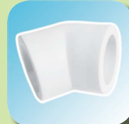
ОТВОД 45° Ø 20, 25, 32, 40, 50, 63