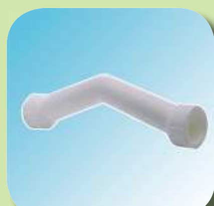
ОБВОД Ø 20, 25, 32