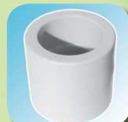
МУФТА Ø 20, 25, 32, 40, 50, 63